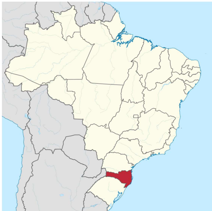
Mapa Político de Santa Catarina