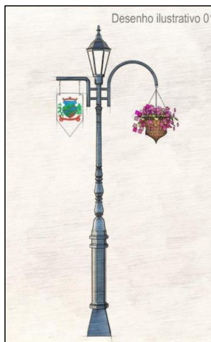
Imagem 02: Desenho Técnico